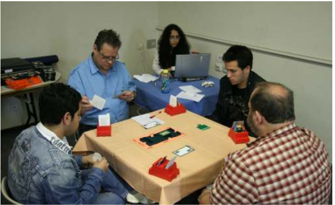
הגמר בין קבוצת אלטשולר לקבוצת האוסטרית משודר ב-BBO